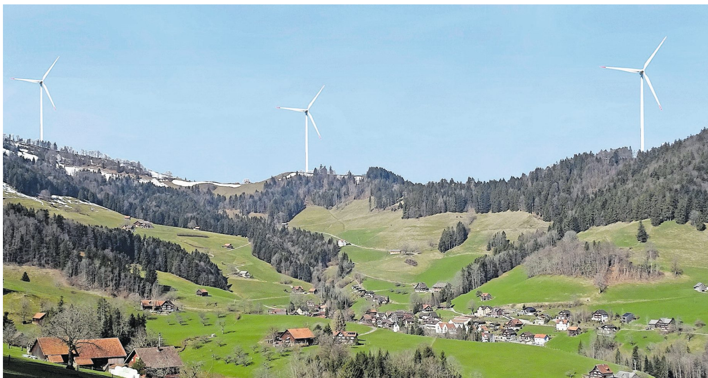
Wie gross ist der Eingriff in die Landschaft wirklich? Die Thurwerke AG (oben) und der Verein Älpli-Gegenwind (unten) haben je eigene Visualisierungen erstellt, wie die geplanten Windenergieanlagen aussehen könnten.