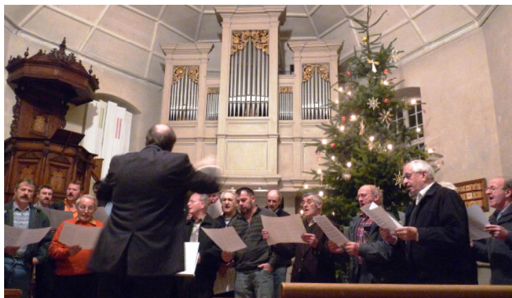
Silvester mit dem Männerchor Krinau